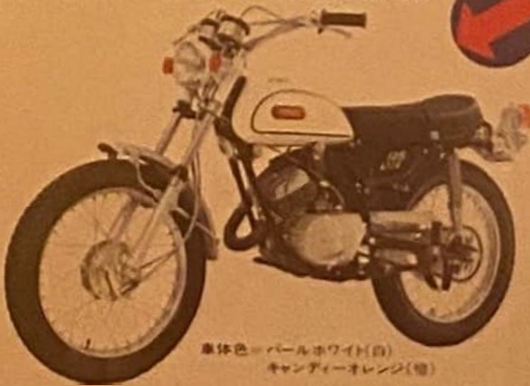
車体色=パールホワイト(白) キャンディーオレンジ(橙)