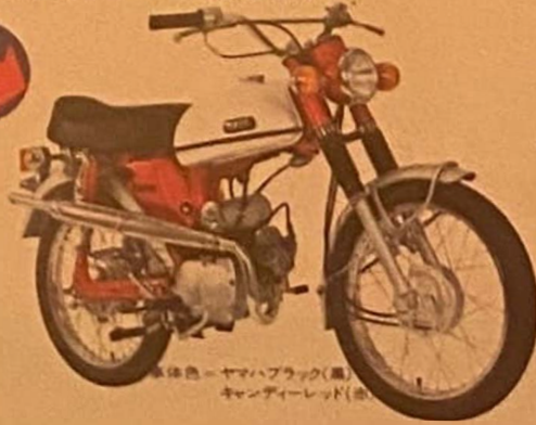
車体色=ヤマハブラック(黒) キャンディーレッド(銀)