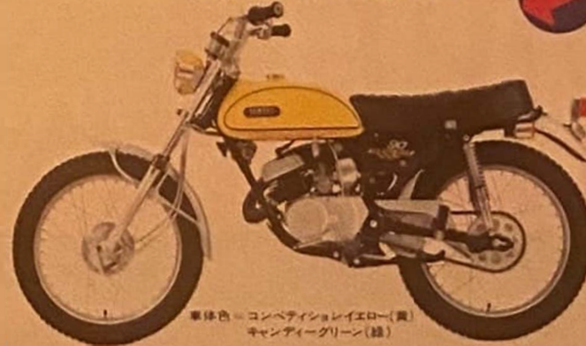
車体色=コンベティンショレイエロー(黄) キャンディーグリーン(緑)