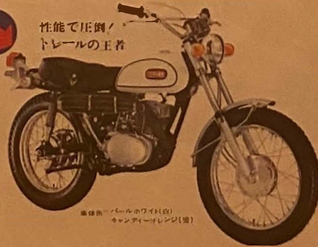
車体色=パールホワイト(白) キャンディーオレンジ(橙)