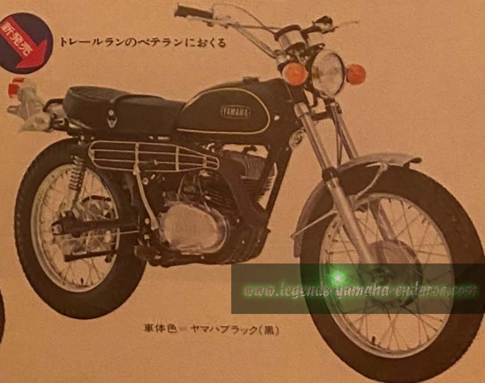
車体色=ヤマハブラック(黒)