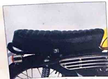
乗り心地のよい静かなキルティングシート