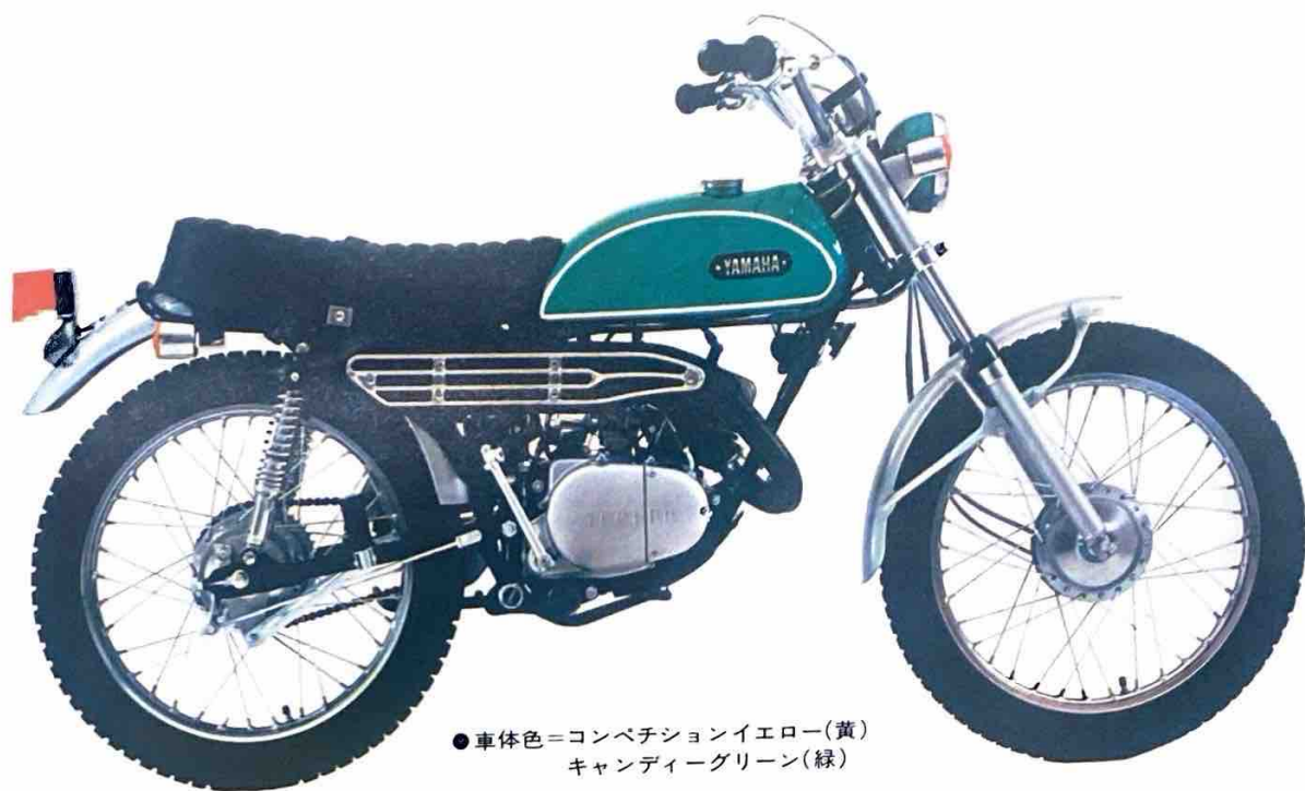
●車体色=コンベクションイエロー(黄) キャンディーグリーン(緑)