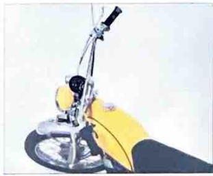
安定した走行をお約束、巾広のプリソ付ハンドル