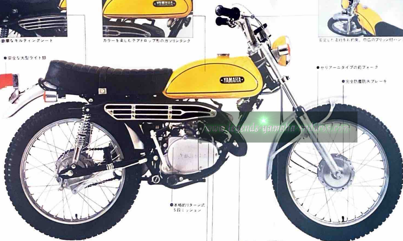
●本格的リターン式5段ミッション