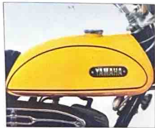
カラーを染しヒテアトランプ形のカノリタンク