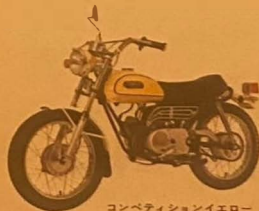
コンペティションイエロー