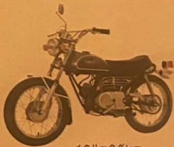
メタリックグレー