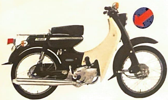
ヤマハメイト70 ハイデラックス U7-A 現金正価 ¥66,000 メイトグレー メイトブルー