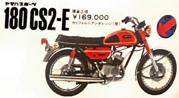
ヤマハスポーツ 180CS2-E 現金正価 ¥169,000 カリフォルニアオレンジ(橙)