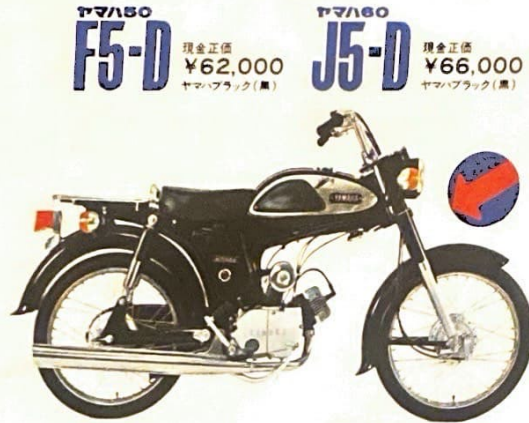
ヤマハ50 F5-D 現金正価 ¥62,000 ヤマハブラック(黒)