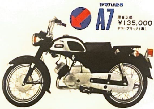
ヤマハ125 A7 現金正価 ¥135,000 ヤマハブラック(黒)