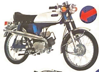
ヤマハスポーツ 50FS1 現金正価 ¥65,000 サンシャインレッド(赤) アドリアンブルー(青)