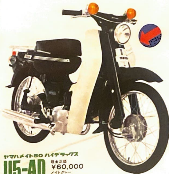
ヤマハメイト50 ハイデラックス U5-AD 現金正価 ¥60,000 メイトグレー メイトブルー