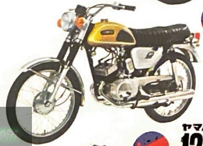
ヤマハスポーツ 90HS1 現金正価 ¥87,000 キャンディーイエロー(黄) アドリアンブルー(青)