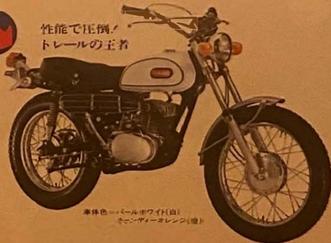
車体色=パールホワイト(白) キャンディーオレンジ(橙)