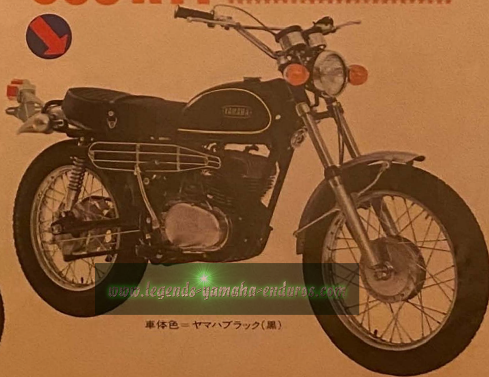
車体色=ヤマハブラック(黒)