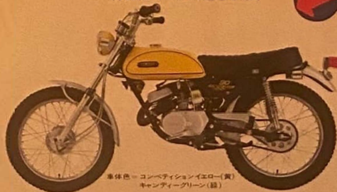
車体色=コンペティションイエロー(黄) キャンディーグリーン(緑)