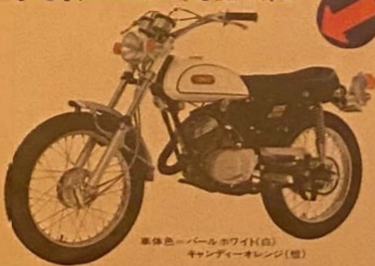
車体色=パールホワイト(白) キャンディーオレンジ(橙)