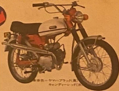
車体色=ヤマハブラック(黒) キャンディーレッド(赤)